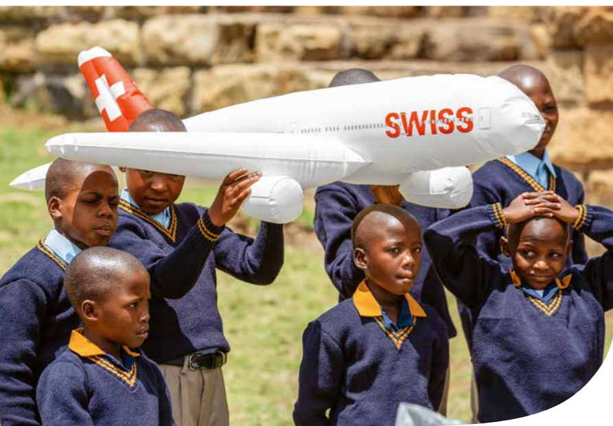
10 UNA COLLABORAZIONE CHE VOLA ALTO Partenariati aziendali