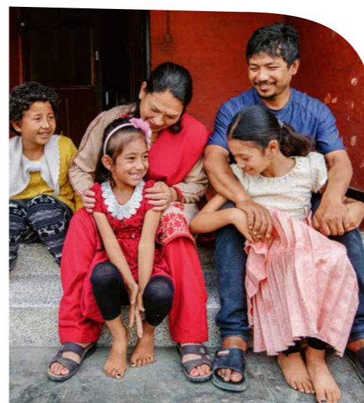
I programmi di rafforzamento familiare (qui a Sanotimi, Nepal) tengono unite le famiglie.   Nina Ruud

Solo fino al 1989, SOS Villaggi dei Bambini Svizzera ha finanziato pi  di 53 case in villaggi dei bambini SOS di tutto il mondo. Dal 1989 sono aumentati anche i finanziamenti completi e l'apertura di interi villaggi dei bambini SOS, ad esempio a Ca Mau in Vietnam, Itahari in Nepal e Tehuacan in Messico. Da allora e fino a oggi siamo riusciti ad aiutare innumerevoli bambini e ragazzi, che hanno perso i genitori o le cui famiglie non sono in grado di prendersi cura di loro, a trovare una nuova casa e una vera opportunit  per plasmare il proprio futuro in autonomia. Le storie di chi   cresciuto nei villaggi dei bambini SOS, come quella del Dr. Dev a pagina 8, illustrano in modo palese la differenza che il nostro lavoro fa nella vita concreta delle persone.