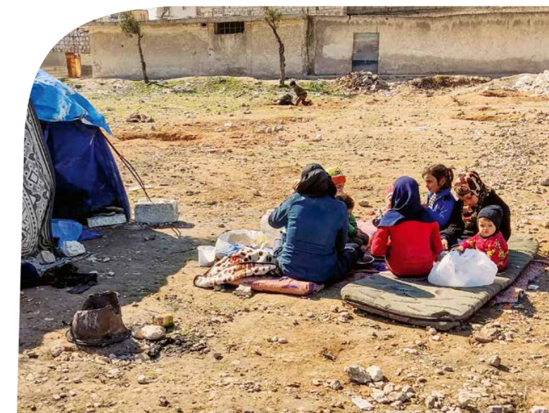
Anche nel 2023 SOS Villaggi dei Bambini ha lanciato campagne di aiuto d'emergenza (qui dopo il terremoto al confine tra Siria e Turchia).