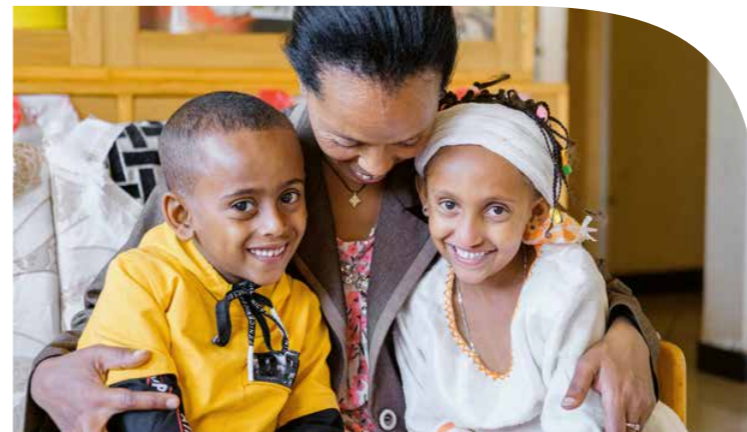
Due gemelli con la madre SOS cresciuti nel villaggio dei bambini SOS di Jimma, in Etiopia.   Jakob Fuhr