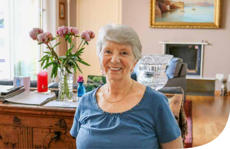
06 «UNA VITA PER I BAMBINI» Svizzera