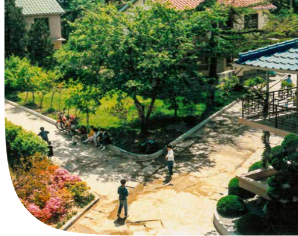
04 LE PIETRE MILIARI DELLA NOSTRA STORIA In tutto il mondo